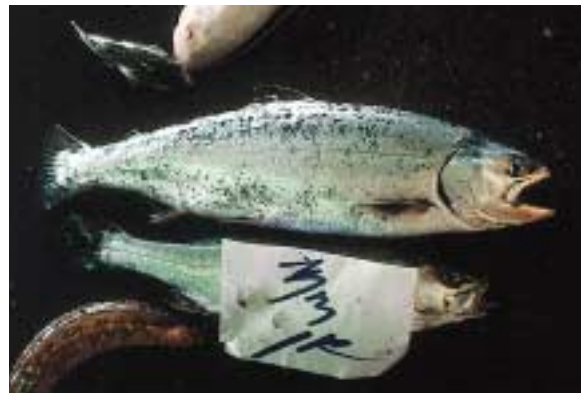
海で漁獲され、市場に並んだサクラマス

ここでちょっと気に留めてもらいたいことがあります。海で大きく育ったサクラマスは、やまめが住む場所まで川を上らなければなりません。ところが川には、サクラマスが飛び越えられないえん堤やダムが少なくありません。生まれた場所にもどれないサクラマスも多いようです。