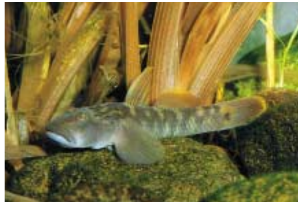
背ビレと尾ビレの縁が黄色くなるトウヨシノボリ

石川県にはウキゴリ、スミウキゴリ、シマウキゴリの3種が分布していますが、区別が実に難しい仲間です。産卵期は春で、川で生まれた幼魚はそのまま海に下り、全長約2cm程に成長し