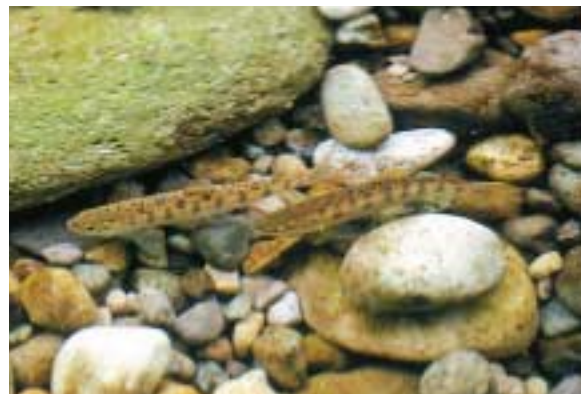
黒い大きな楕円形の斑紋をもつやまめ