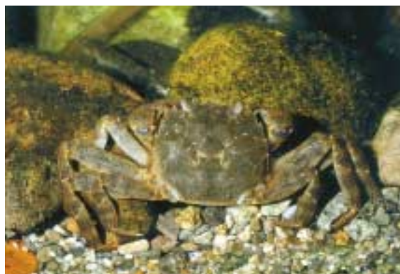
海で幼生を放つモクスガニ