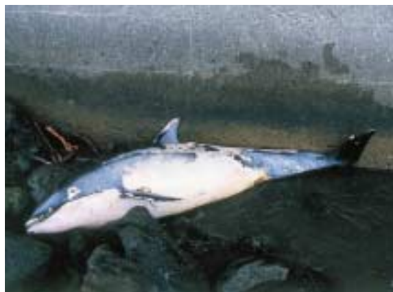
内浦町四方山海岸に漂着したカマイルカ

カマイルカの赤ちゃんは、全長70~80cmで出産されるそうです。この胎児は、この事故さえなければ、もうしばらくで広い日本海を自由に飛び跳ねていたことでしょう。(普及課 主任技師)