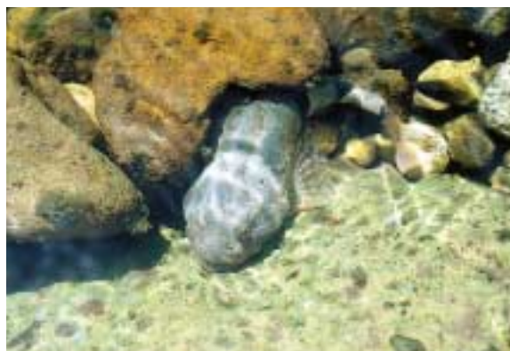
頭が大きいカマキリ、カジカの仲間です