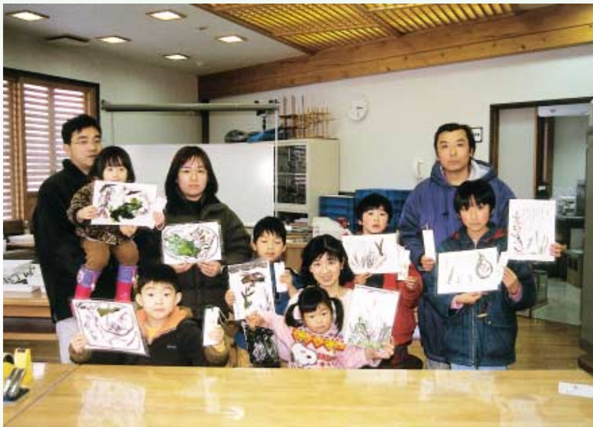
サタデースクール「海藻クラフトづくり」の参加者と作品（平成12年2月26日）

NEWS LETTER OF NOTO MARINE CENTER No.13, Sept. 2000