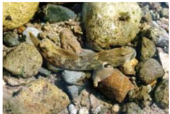
胸ビレにひし形の斑紋をもつオオヨシノボリ