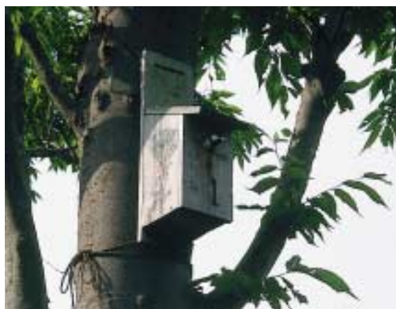
フンをくわえて巣箱から出てきたシジュウカラ