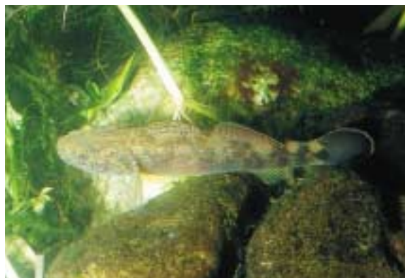
背ビレに黒斑がないのがスミウキゴリの特徴

この他、海辺の小川や湿気の多い林の中では、アカテガニやクロベンケイガニが住んでいます。土に穴を掘り、これを巣穴にして生活しています。これらのカニも、普段は海に入ることはありません。ところが、メス親が幼生を放つのは必ず海の中です。幼生は海で成長を続け、親と同じ姿になると陸で生活するようになります。(普及課長)