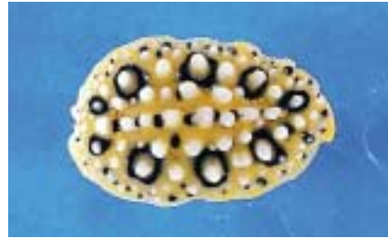
九十九湾で見つかったキイロイボウミウシ