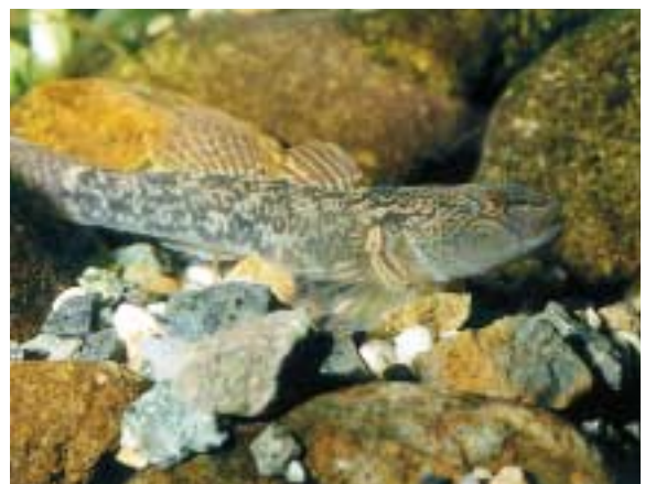
海に入ることのないカワヨシノボリ