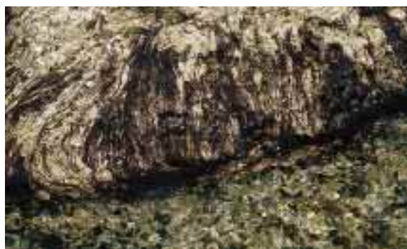
海藻のウミゾウメン

あめふらしの仲間は、その形からは考えられないと思いますが、さざえやあわびなどと同じ巻貝の仲間です。この卵塊をしばらく飼育すると幼生がフ化するので、これを見ていただければ納得できると思います。