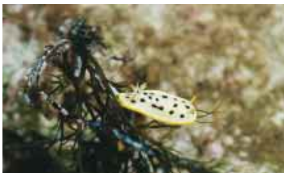
うみぞうしの仲間シロウミウシ