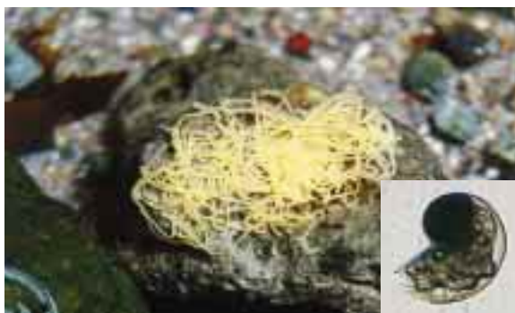
アメフラシの卵塊うみぞうめんと生まれた幼生