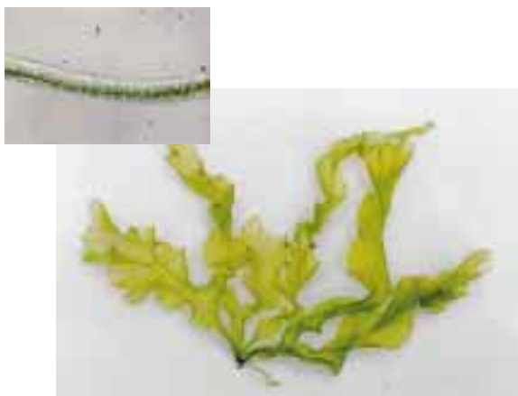
ウスバアオノリと体断面の顕微鏡写真