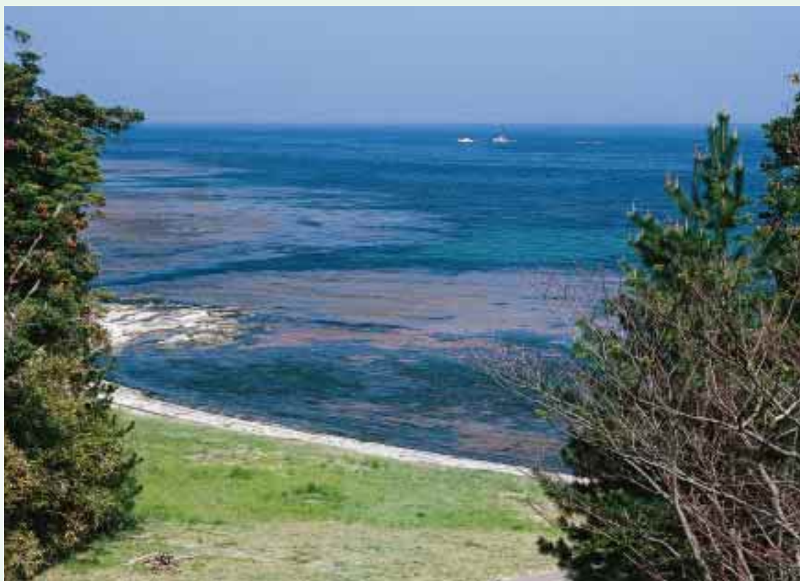
春、センター前の海岸では長く伸びたホンダワラ類が海面をおおいます

NEWS LETTER OF NOTO MARINE CENTER No.12, Feb. 2000