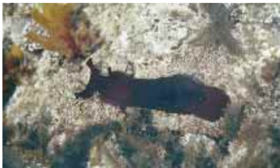
あめふらしの仲間アマクサアメフラシ

ことができる磯の生きものです。海の中で、「僕はあめふらしじゃない！うみぞうめだあ！」と叫んでいるかもしれません。