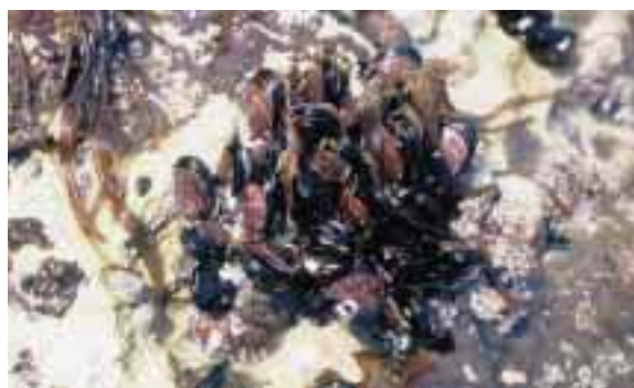
自然海岸に多いムラサキインコガイ