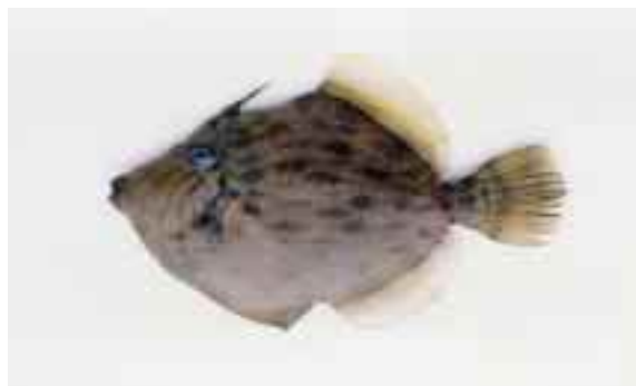
四角い体をしたカワハギ