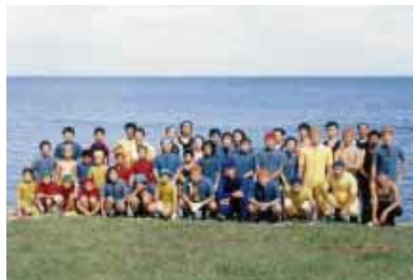
平成11年度スノーケリング講習会の参加者