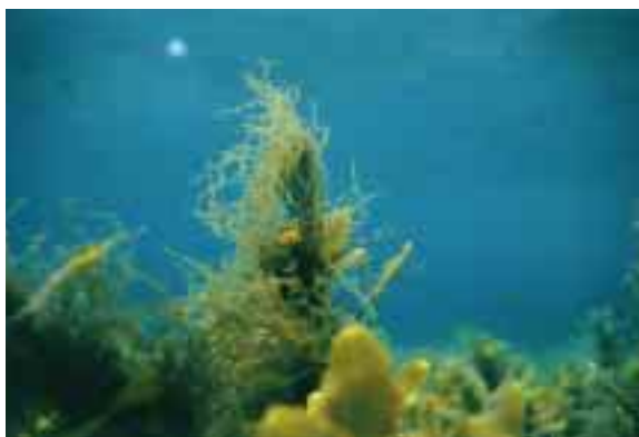
ホンダワラ類に絡まって育つモズク