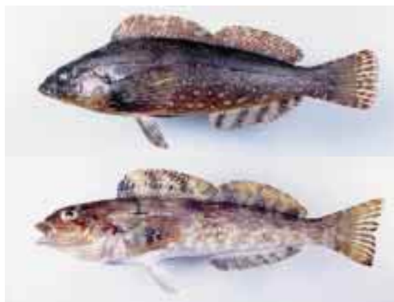
クジメ(上)とアイナメ(下)

両者とも、白身で淡白な味なので、煮付けやなべ物、みそ汁などで食べられていますが、新鮮なものは刺身にしてもおいしい魚です。