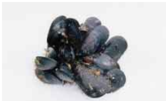
港の岸壁などに多いムラサキイガイ

多く、40cm位にまで成長する種類もいます。体は胴の部分が丸く膨らみ、頭の部分と簡単に区別できます。また、種類によってはここに貝殻を持っているものもいます。あめふらしの仲間には、つまえると紫色や乳白色の液を出すものがあります。しかし、この液は人間に害を与えるようなものではありません。また、この様な液をまったく出さない種類もいるのです。