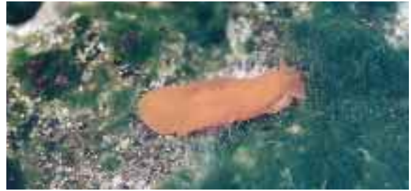
早春、磯の観察路に姿を現すハウズキフシエラガイ