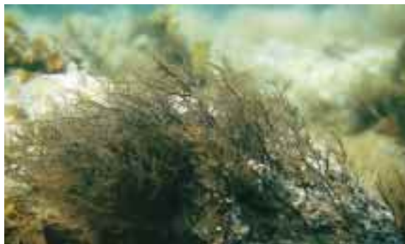
石から直接育つイシモズク