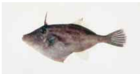
長い顔をしたウマツラハギ