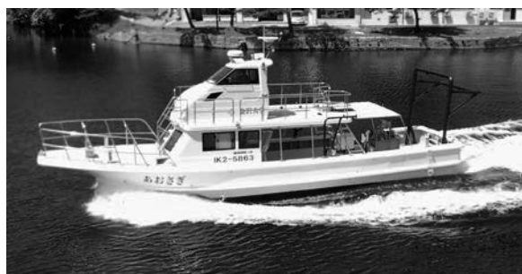
図 1 調査実習船「あおさぎ」。全長 13.59 m, 総トン数 6.6 トン, 最大搭載人員 22 名。

調査は九十九湾にある金沢大学環日本海域環境研究センター臨海実験施設の調査実習船「あおさぎ」を用いて実施した(図 1)。「あおさぎ」は 2023 年 4 月に 42 年ぶりに更新され、水深 450 m までの海底地形を測れるマルチビームソナーと 1,000 m ワイヤーウインチを備え、これにより水深 400 m 程度までのドレッジ調査が可能となった。ドレッジは開口部幅 50 cm、高さ 20 cm、バッグ長 100 cm の株式会社離合社製簡易ドレッジ大型を用いた。調査ではドレッジ前方に 10 kg の錘を取り付け、調査地点の水深の 2 倍から 3 倍の長さのワイヤーを伸ばしてドレッジを曳航した。曳航時間は水深 200 m までは 5 分間、それ以深では 10 分間を目安とした。2023 年 5 月 8 日から 2025 年 6 月 3 日までに 15 回の調査を実施し、実施順に NML ドレッジ No. 1-15 とした。各調査ではドレッジの投入時、着底時、曳航開始時、曳航終了時、離底時、回収時にそれぞれ時刻と位置情報、水深を記録した(表 1)。ドレッジの着底から離底までの距離は、位置情報を基に国土地理院の測量計算サイトの「距離と方位角の計算」