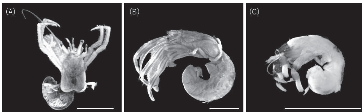
Figure 2. ゴホンアカシマホンヤドカリ Pagurus quinquelineatus (A), クロシマホンヤドカリ Pagurus nigrivittatus (B), and イノコバサミ Clibanarius virescens (C). Scale bars: 5 mm.