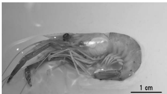
図4 ミナミテナガエビ(エタノール固定後)