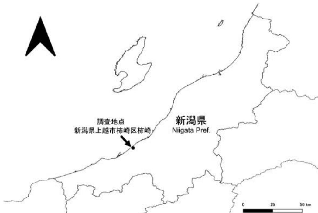
図 1 採集場所: 新潟県上越市柿崎区柿崎