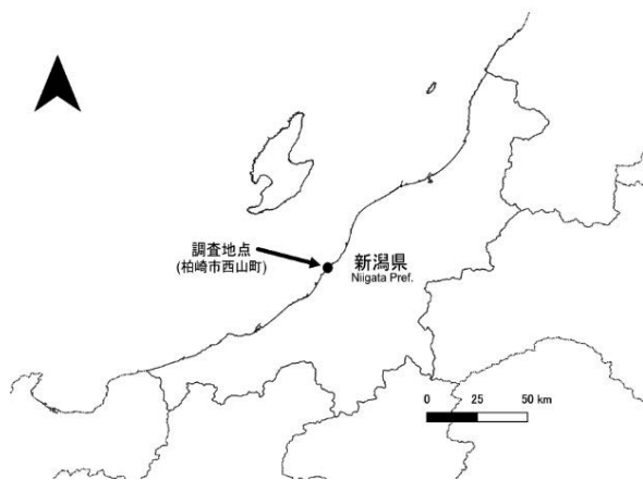
図 1 調査地

採集した個体は新潟市水族館で飼育・展示しているが、1 個体は 2023 年に死亡し、他 2 個体は 1 個体ずつ別の水槽で飼育・展示中である。今回 2 個体を水槽から取り上げて記録するのは困難であったため、取り上げ可能であった 1 個体を記録する(図 4)。飼育個体の計測はデジタルノギス(Mitutoyo 製 CD- S20M: 500- 405) を用い、全長と体長、体高を 0.1mm 単位まで計測し記録した。