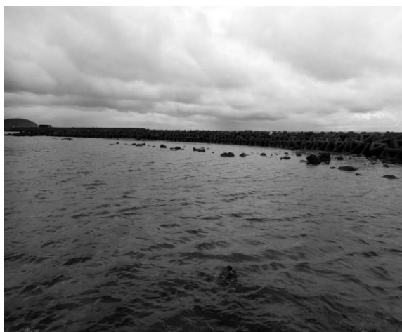
図 2 採集場所: 柏崎市西山町沿岸