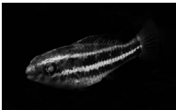
図 3 採集時のアオブダイ